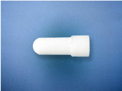
Fig. 2 – PE tip