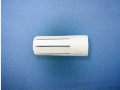
Fig. 1 – Polyamide tip