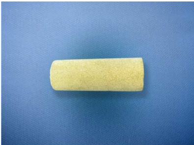
Fig. 3 – Sintered bronze tip